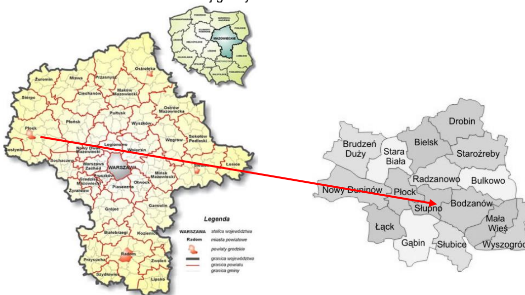
Ryc. 1 Województwo mazowieckie i jego położenie na tle kraju

Gmina Słupno leży w północno – zachodniej części województwa mazowieckiego w powiecie płockim. Na dzień 31 grudnia 2014 r. według danych GUS gminę zamieszkiwało łącznie 7145 osób w tym mężczyźni 3563 i kobiety 3582 osób. Gmina zajmuje stosunkowo niewielką powierzchnię – 74,7 km 2 . Największymi miejscowościami gminy są : siedziba gminy - Słupno oraz Nowe Gulczewo. Ponadto miejscowości Clekanowo i Borowiczki Pieńki są ośrodkami gdzie bardzo intensywnie rozwija się budownictwo mieszkaniowe na tle całej gminy.