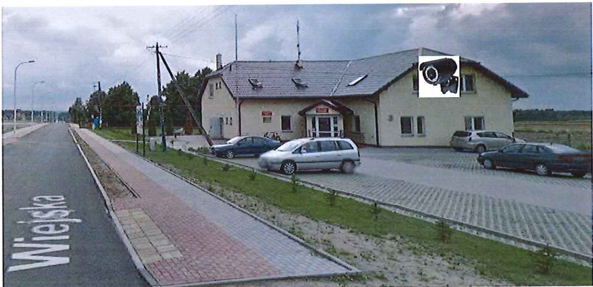
4. Budynek Gminnego Ośrodka Kultury w Słupnie z siedzibą w Cekanowie