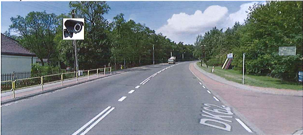
1. Skrzyżowanie DK-62 z ul Kościelną w Słupnie