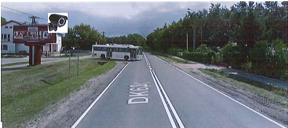
2. Billboard przy DK 62 w Słupnie