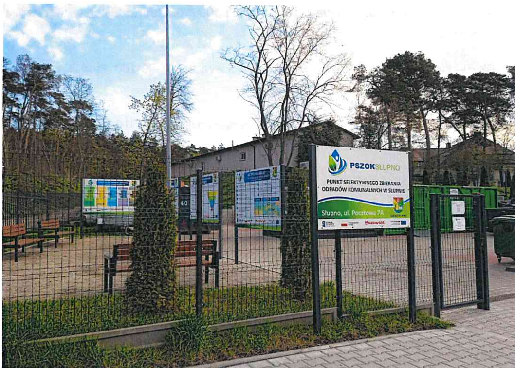
Fot.1 Punkt Selektywnego Zbierania Odpadów Komunalnych w Słupnie

Potrzeby inwestycyjne to doposażenie PSZOK w postaci budowy zadaszzonego boksu oraz montażu wagi najazdowej.