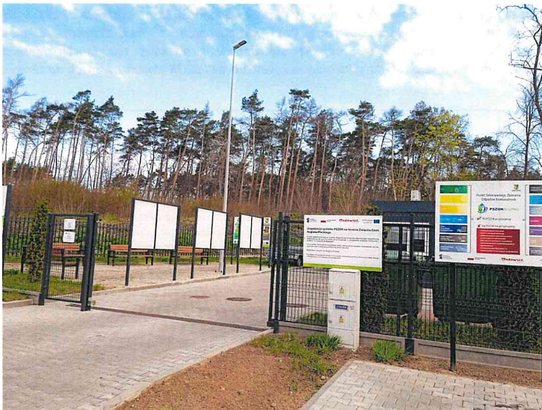
Fot.2 Punkt Selektywnego Zbierania Odpadów Komunalnych w Słupnie

Priorytetowym zadaniem jest dalsza edukacja ekologiczna mieszkańców w zakresie gospodarki odpadami komunalnymi oraz podjęcie działań mających na celu ograniczenie ilości wytwarzanych odpadów komunalnych, w szczególności bioodpadów oraz niesegregowanych (zmieszanych) odpadów komunalnych.