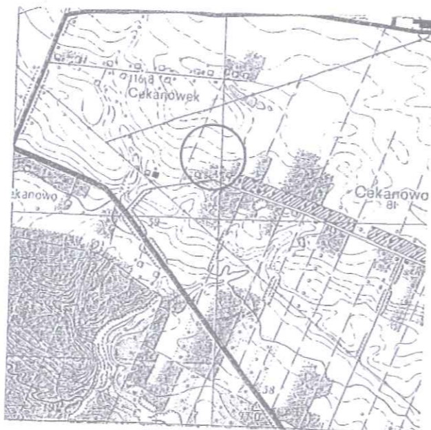
Szkic orientacyjny skala 1: 25 000

Opracowanie na podstawie fragmentu arkusza mapy syt-wys nr 262.114.014 Mapa przedstawia stan na dzień 2010-11-05