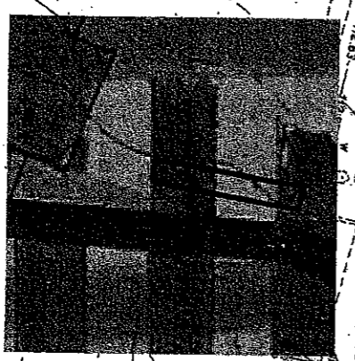
FRAGMENT STUDIUM UMARUNKOWAN I KIERUNKÓW ZAGOSPODAROWANIA PRZESTRZENNEGO GMINY SŁUPNO